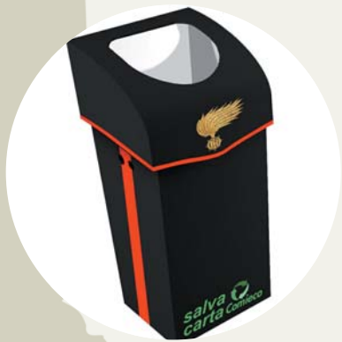
Lo speciale "Salvacarta" dei Carabinieri